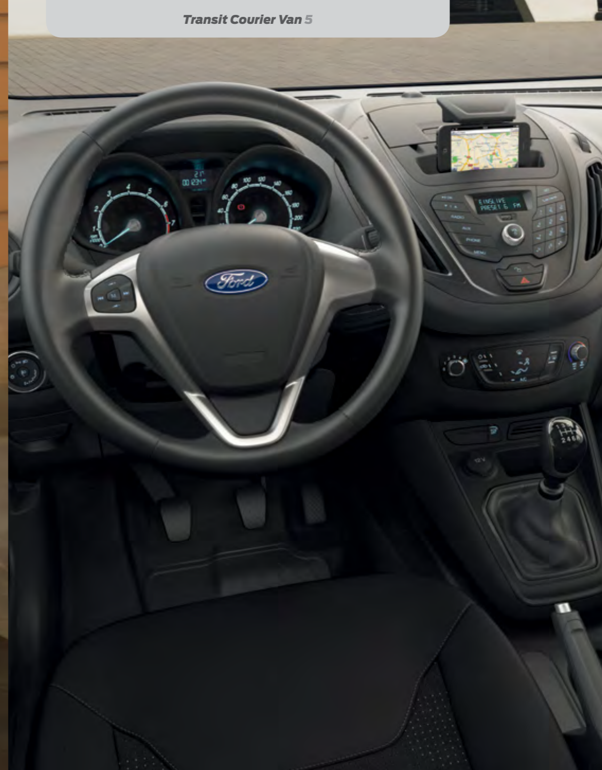
Transit Courier Van 5