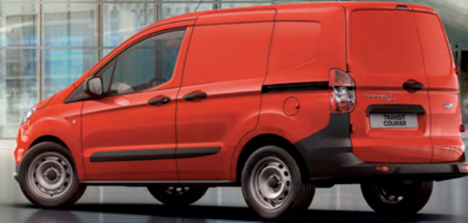
Görselde yer alan araç Transit Courier Van modelidir.