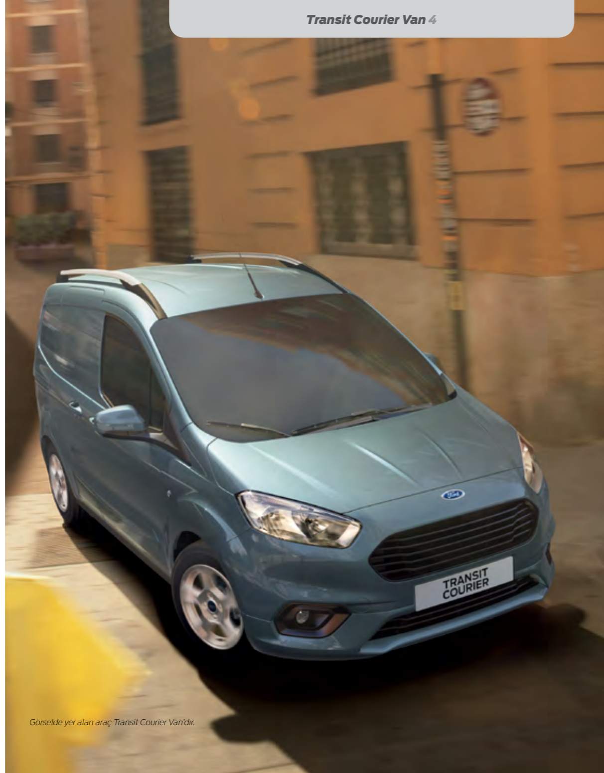
Görselde yer alan araç Transit Courier Van'dir.