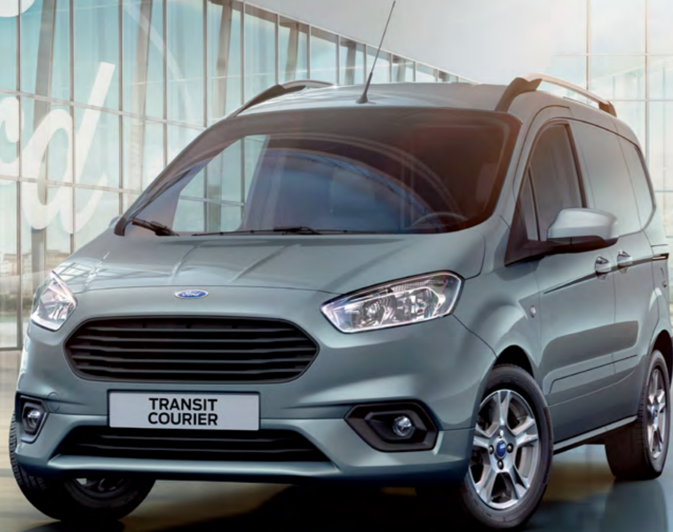
Görselde yer alan araç Transit Courier Van modelidir.