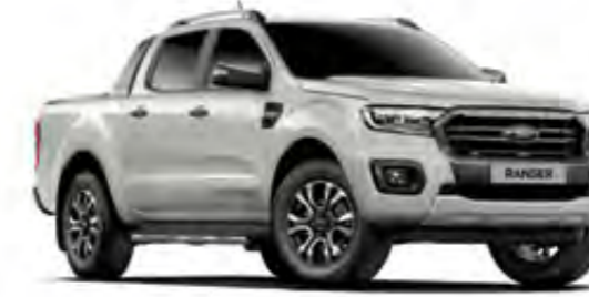
Aytozu Gri Metalik*