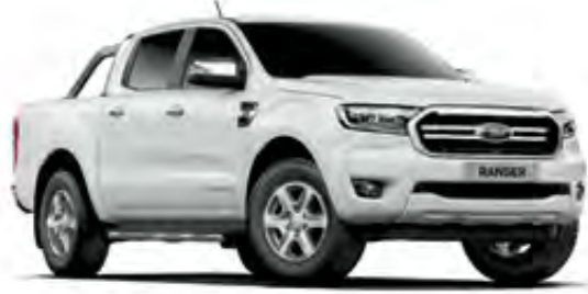
Buz Beyazı Opak

Kişiliğinize en uygun renkleri ve döşemeyi seçiniz.