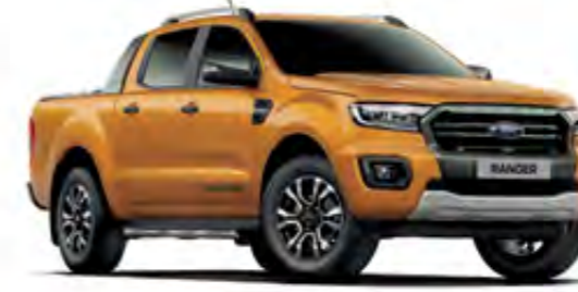
Çöl Turuncusu Metalik* (Wildtrak)