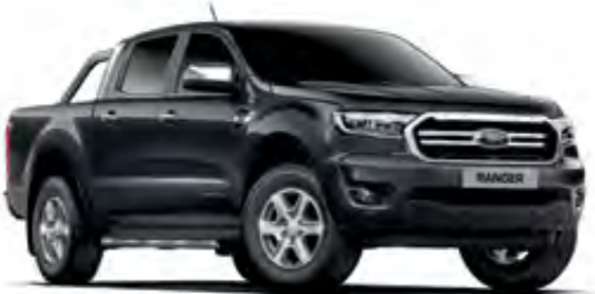
İnci Siyahı Metalik*