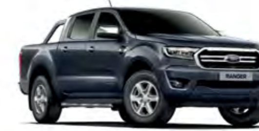
Fırtına Gri Metalik*