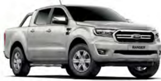
Aytozu Gri Metalik*