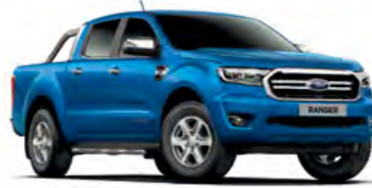
Yıldırım Mavi Metalik*