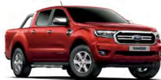
Bakır Kırmızısı Metalik*

Paslanmaya karşı 12 yıl garanti Tizit şekilde uygulanmış çok aşamalı bir boyama süreci sayesinde, Yeni Ford Ranger çok sağlam bir dış görünüme sahiptir. Mumla mühürlenmiş çelik kaporta parçalarından dayanıklı son kat boyaya kadar yeni malzemeler ve işleme süreçleri aracınızın yıllar boyu iyi görünmesini sağlar.