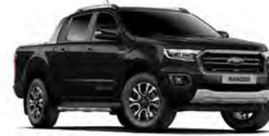
İnci Siyahı Metalik*