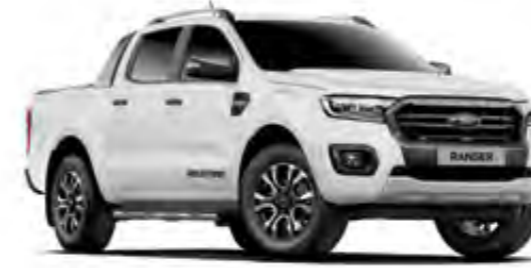
Buz Beyazı Opak