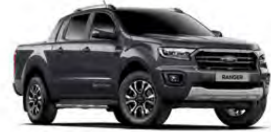
Fırtına Gri Metalik*