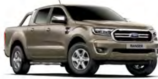
Kumsal Gri Metalik*