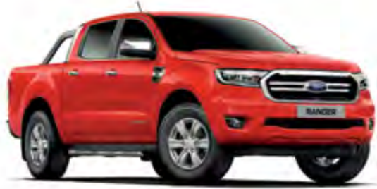
Colorado Kırmızısı Opak