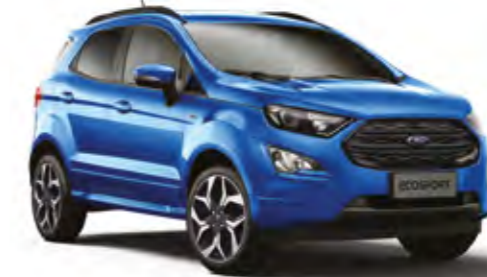
Ada Mavisı Metalik*

Bizim tercihimiz Ada Mavisı'nden yana oldu. Peki, sizin favoriniz hangi renk?