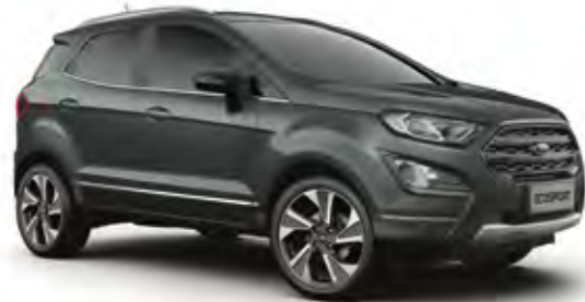
Manyetik Gri Metalik*