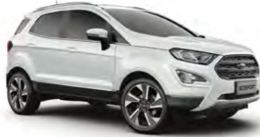
Buz Beyazı Opak