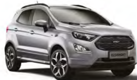
Kurşun Gri Metalik*