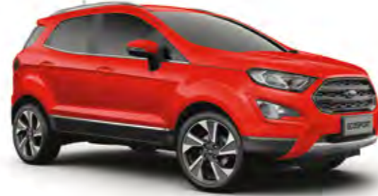
Spor Kırmızı Opak