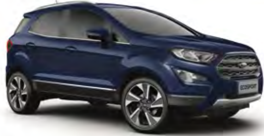
Blazer Mavi Opak