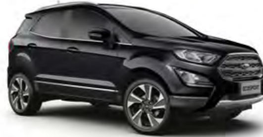
Akik Siyah Metalik*