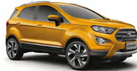
Altın Sarı Metalik*