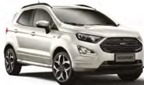
Metropol Beyaz Metalik*