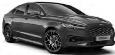
Manyetik Gri Metalik*