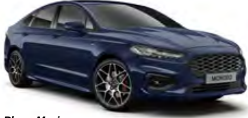
Blazer Mavi Opak