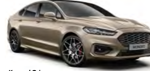
Kumsal Gri Metalik*