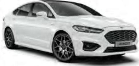
Buz Beyazı Opak