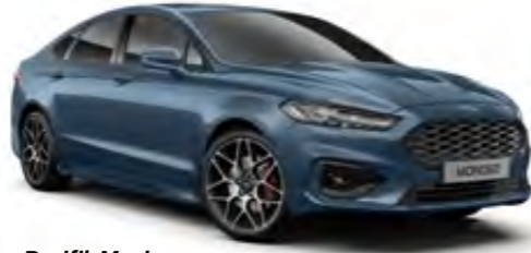
Pasifik Mavi Metalik*

Biz Kumsal Gri'yi setik. Sizin renginiz hangisi?