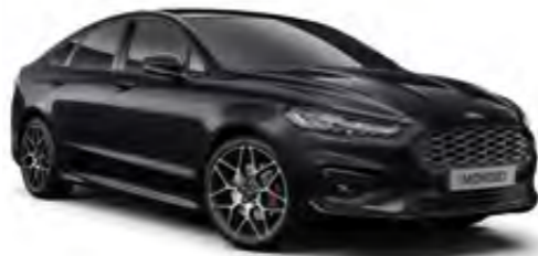
İnci Siyahı Metalik*