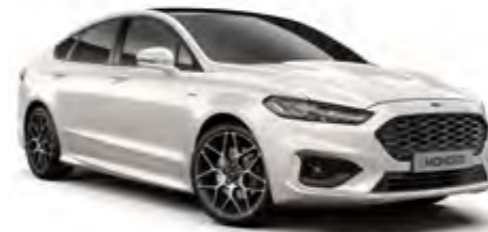
Platin Beyaz zel Metalik