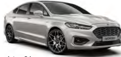
Aytozu Gri Metalik*