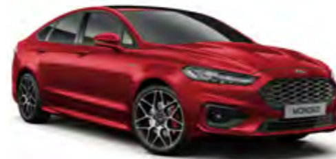
Yakut Kırmızı Metalik*